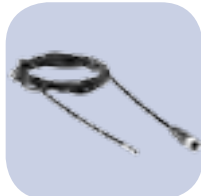
007935911960 VIDEO endoskop do vision