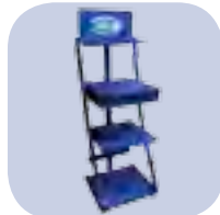
007935830170 wózek diagnostyczny