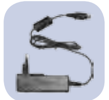
007935830020 ładowarka sieciowa-vision/smart/logic