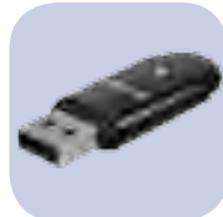
007950006420 Bluetooth do PC